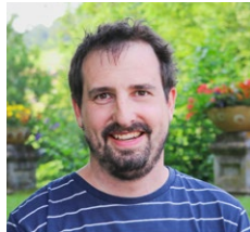
Jampen Christian Mitarbeiter Wäscherei 20 Jahre